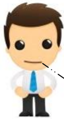
Assistant de gestion

Notre entreprise doit 3 385,64 € au fournisseur LAUZIERES c'est le net à payer de la facture (c'est la RESSOURCE ).