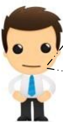
Assistant de gestion

Nous avons réglé par chèque la facture FF00000004 d'un montant de 3 385,64 € au fournisseur LAUZIERES (c'est l' EMPLOI )