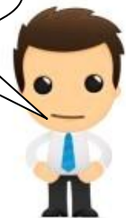
Assistant de gestion

Je fais le lien entre la facture et l'écriture comptable.