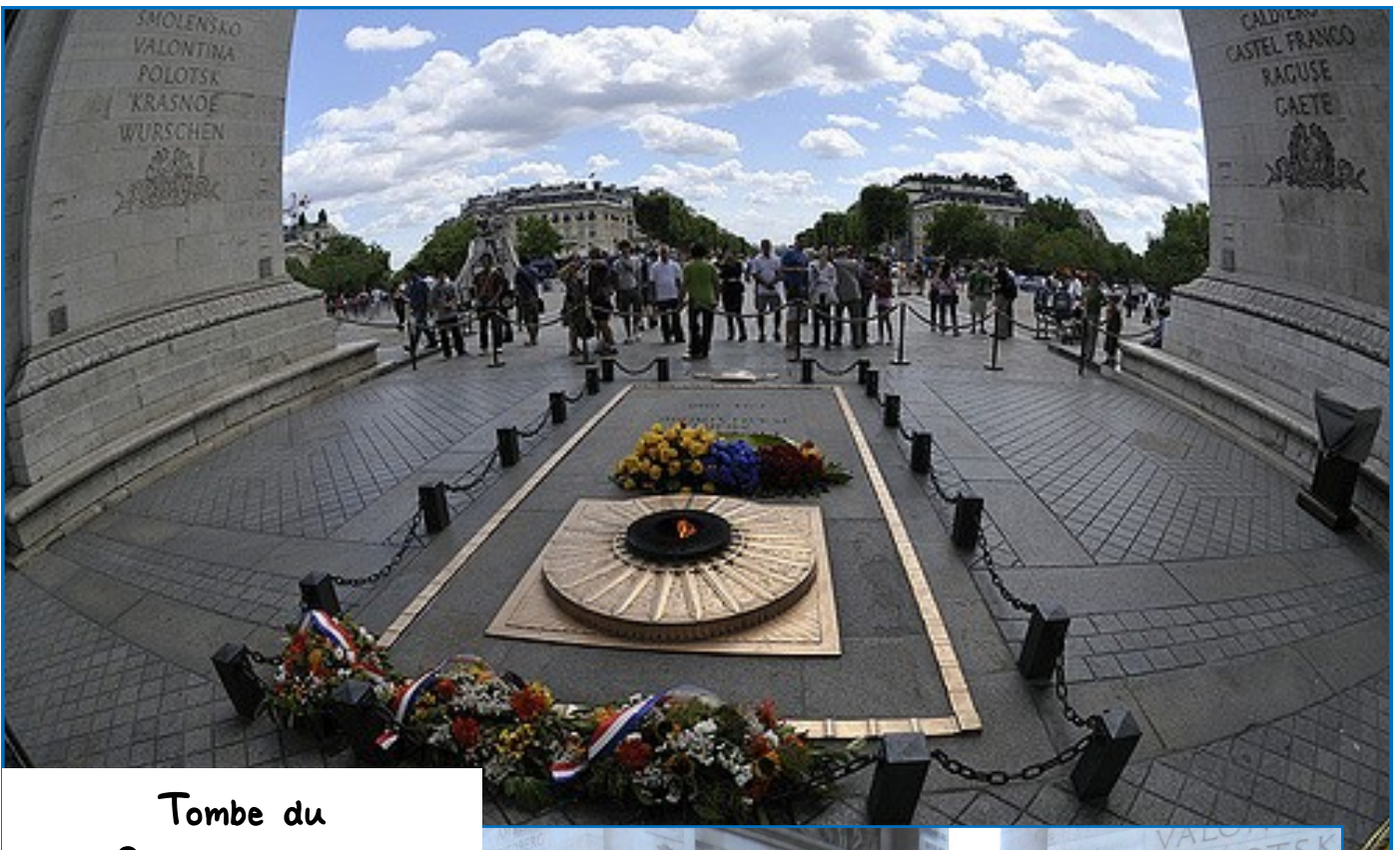
Tombe du Soldat Inconnu

Enfin, je tiens à remercier l'Association des Parents d'Elèves et le Ministère des Armées pour avoir apporté leur soutien financier à ce projet pédagogique afin d'en limiter le coût pour les familles.