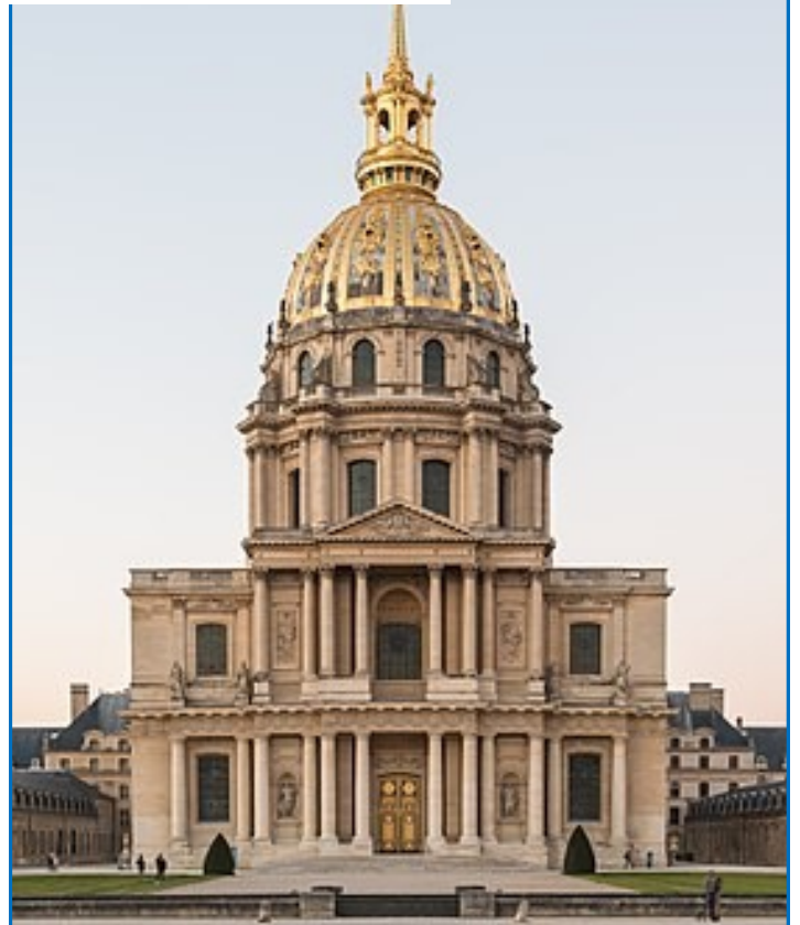
Eglise du Dome