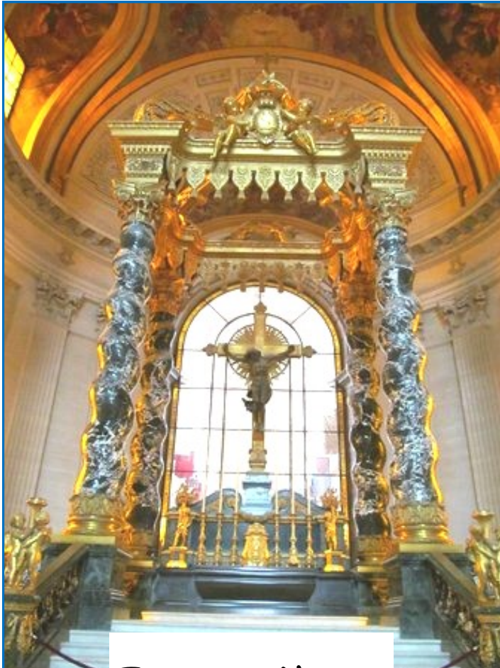
Tombeau de Napoleon

La visite des Invalides , hôpital militaire d'avant-garde créé par Louis XIV afin de prendre en charge les soldats blessés lors des différents conflits militaires, dont aujourd'hui une partie des lieux sert toujours à soigner des civils et une autre partie ayant été transformée en musée des Armées retraçant entre autre le rôle de Louis XIV et Napoléon Ier comme Chefs des Armées.